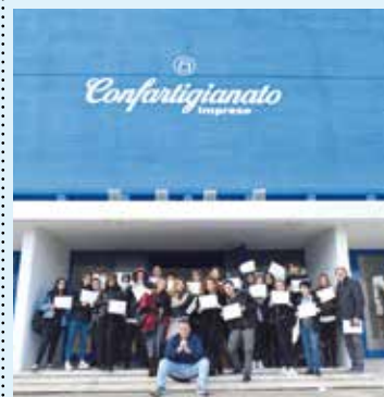
I partecipanti a Botteghe Didattiche Lab