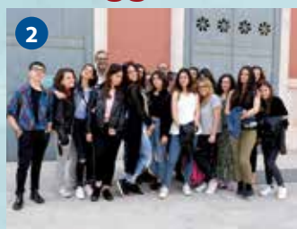
2 Teatro Petruzzelli (Bari)