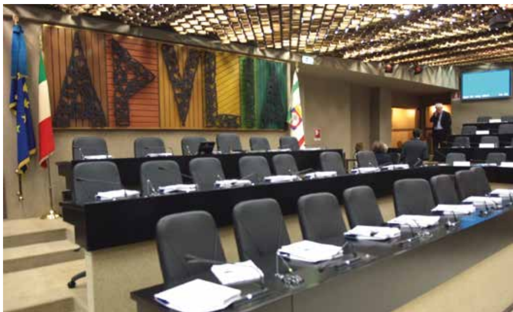
I banchi del Consiglio Regionale

Non basta: la normativa approvata dal Consiglio regionale riordina altresì l'intera materia delle botteghe scuola e dei maestri artigiani. Si tratta di un sistema la cui attuazione attendia-