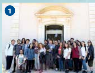
1 Pleroo Design (Gioia del Colle), Mazzarelli Creative Resort (Triggianello)