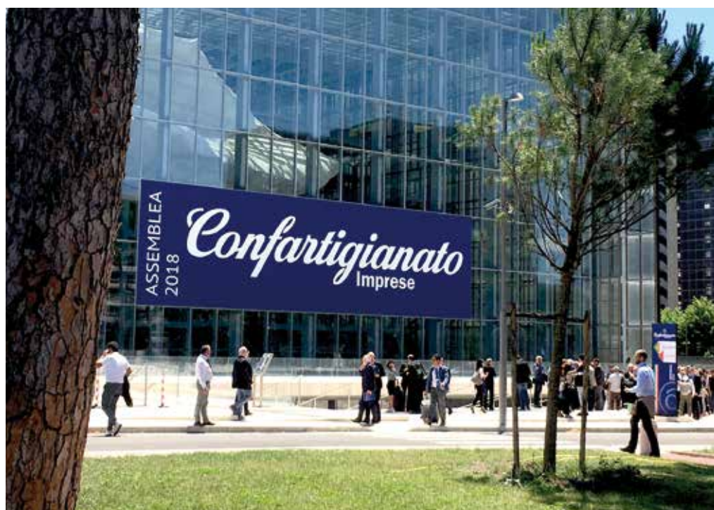
L'auditorium "Nuvola" all'Eur. In basso a sinistra il ministro Salvini. A destra Merletti e Di Maio

politica come servizio ai cittadini e, in particolare, a quelli che concorrono al benessere di tutti".