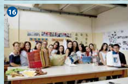
5-12 - I.I.S.S. Federico II Stupor Mundi (Corato); 13-16 - I.P.S.I.A. Luigi Santarella (Bitetto)