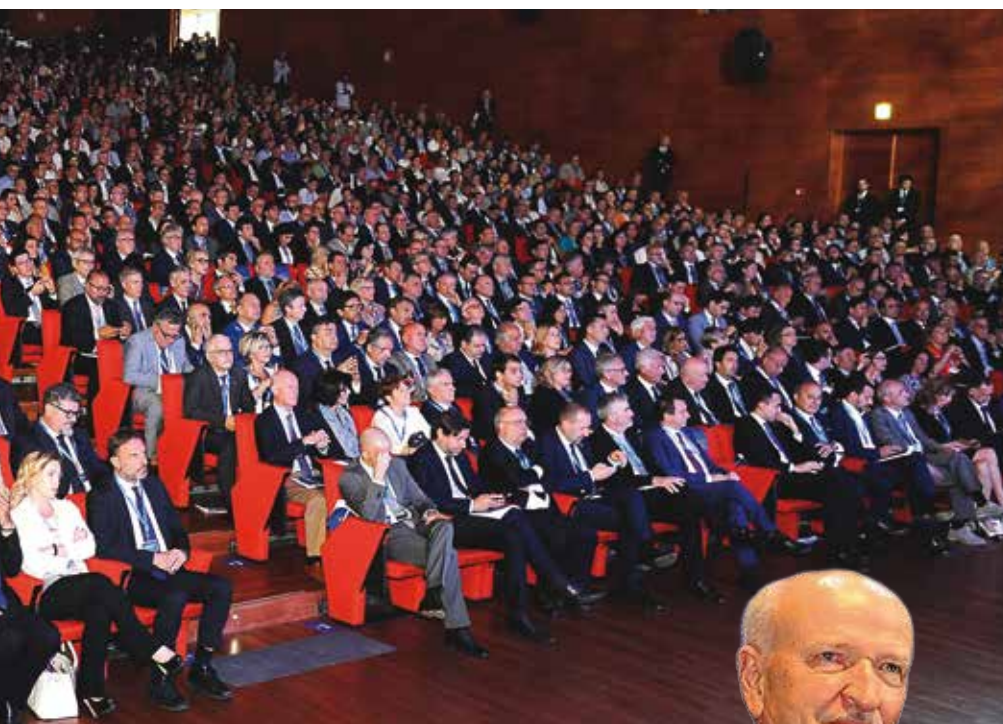
La sala gremita di delegati e parlamentari

sti dell'energia, abolizione del SISTRI. Un'Europa madre e non matrigna