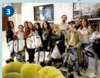
3 MASqueMAS - Misia Arte (Bari)