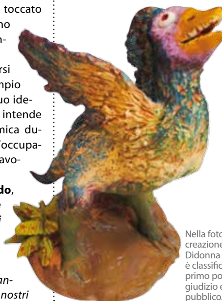
Nella foto, la creazione di Caterina Didonna che si è classificata al primo posto con giudizio espresso dal pubblico.