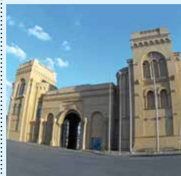
L'ingresso monumentale della Fiera del Levante

GrafiSystem s.n.c. Via dei Gladioli 6, A/3 70026 Modugno Z.I. (Bari) Tel. 080.5375408 - 5375476 Fax 080.5308771 info@grafisystem.it www.grafisystem.it