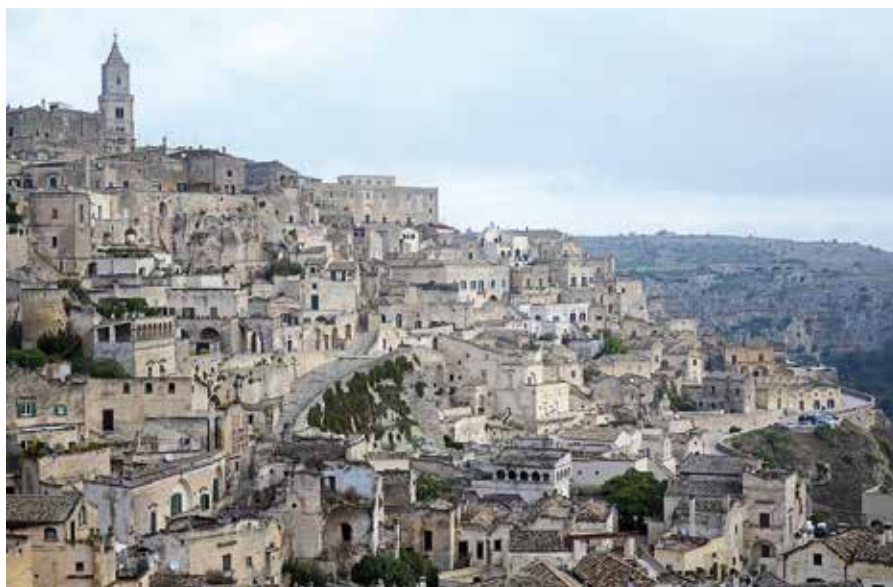
Una veduta dei Sassi di Matera, in Basilicata, regione col più alto tasso di crescita di turisti

Dove il turismo è cresciuto di più negli ultimi anni. L'analisi in serie storica delle presenze turistiche – l'analisi valuta la dinamica della media dell'ultimo triennio 2015-2017 rispetto alla media del 2010-2012 – evidenzia una crescita del 6,4% rispetto al triennio precedente; la crescita è tutta determinata dalle presenze straniere (+15,4%) mentre quelle degli italiani sono in diminuzione (-1,1%). Tra le regioni il maggiore dinamismo è rilevato per la Basilicata (+24,6%), seguita da Lombardia (+17,2%), Sardegna (+16,4%), Piemonte