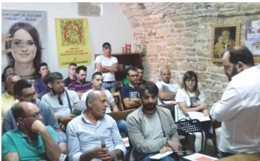
Una lezione del corso per la sicurezza sui luoghi di lavoro.